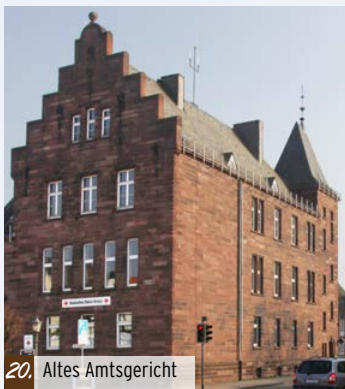
20. Altes Amtsgericht

20. Altes Amtsgericht (Burgstr. 26) Dieser dreigeschossige Sollingquaderbau von 1892 mit Staffelgiebel, seitlichem Anbau und Treppenturm wurde bis 1969 als Amtsgericht genutzt, worauf auch das Preußenadler-Relief über dem Rundportal verweist. Das Schieferdach unterstreicht den Neo-Renaissancestil. Das Gebäude wurde im Bereich der ehemaligen Vorburg errichtet.