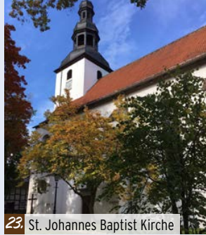
23. St. Johannes Baptist Kirche

17. Stadthalle (Kolpingstr. 5) Hier stand von 1926 bis 1976 das Kolpinghaus mit Saal und Bühne. Nach dem Abriss erfolgte die Errichtung der ersten Stadthalle, die jedoch am 26.12.1996 Opfer eines Großbrandes wurde. Im Jahre 1998 konnte an gleicher Stelle die neue Stadthalle eingeweiht und damit die Tradition eines vielfältigen kulturellen Angebots fortgesetzt werden.