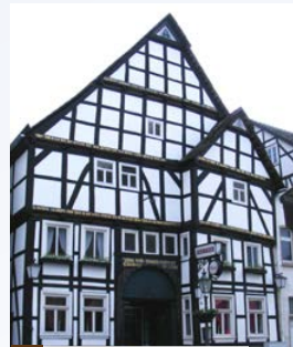
6. Altd deutsches Gasthaus

6. Altd deutsches Gasthaus (Weserstr. 4) Dieses Gebäude ist ein 2 1/2-geschossiges Haus von 1611 mit Sollingplattendach, übergiebeltem Vorbau (Utlucht), Schnitzbalken und Inschriften. Das Hauptgeschoss mit Toreinfahrt wird von großen, zweigeschossigen Stubeneinbauten flankiert. Das über dem Schwellbalken gelegene Stockwerk war der Speicher. Das älteste Haus der Stadt wurde vom 17. Jahrhundert bis 1975 als Gasthaus genutzt. Der 6,50 m tiefe Brunnen im Haus ist eine Besonderheit, weil gewöhnlich die Brunnen außerhalb der Gebäude lagen. Der Brunnen kann besichtigt werden.