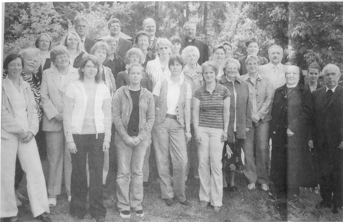
Ehrengäste sowie die derzeitigen und viele ehemalige Mitarbeiterinnen des kath. Kindergartens.

Der in diesem Zusammenhang entstandene Aufsatz ist der diesjährigen Berichterstattung als Anlage beigelegt.